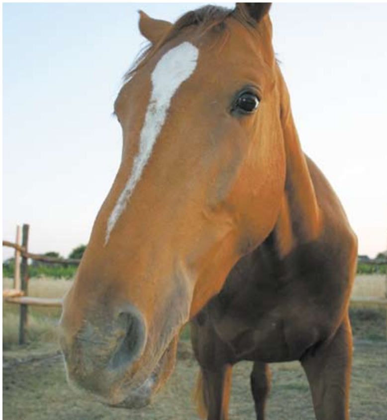
Von außen verliehene Insignien der Macht sind Pferden gegenüber völlig unwirksam.

Ungeachtet dieser matriarchalen Strukturen im Tierreich, sollen Frauen ebenso wie