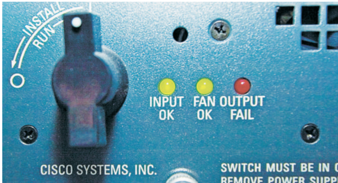
Umfassende Dienstleistungen sowie die individuelle Konfiguration des Service-Levels sichern die Qualität der IT-Leistungen und schaffen Kostentransparenz.

KMU nutzen vermehrt die Möglichkeit, ihre IT mittels Outsourcing zu optimieren. Im Zuge des Prozesses veranstalten wir mit Kunden Workshops, um Lösungen zu erarbeiten. Vor allem kleineren KMU mangelt es an der nötigen Transpa-