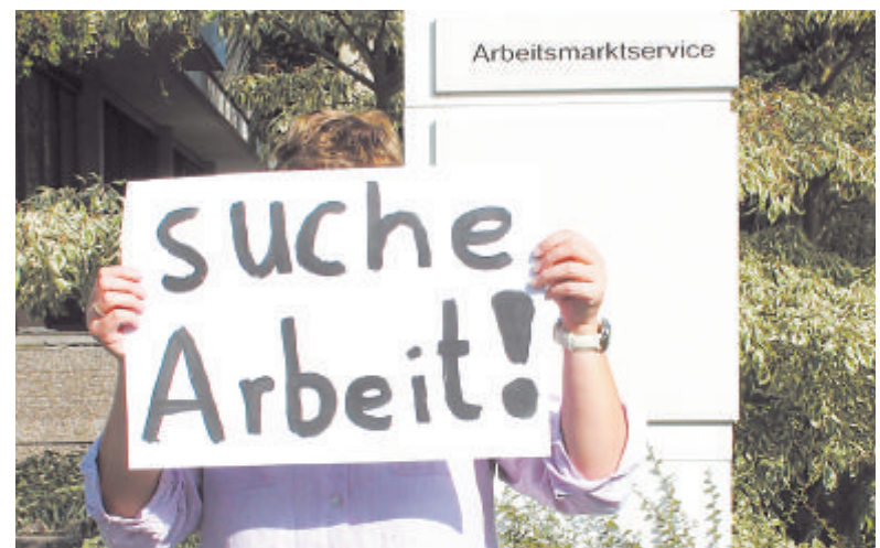
Der Staat hat Lenkungsinstrumente, um Arbeitslose zumindest wieder in den Arbeitsprozess zurückzuführen.

Denn während die Diskriminierung aufgrund von Hautfarbe und Geschlecht zurückgegangen ist, ist eine andere aufgetaucht: Menschen mit einer „geringeren